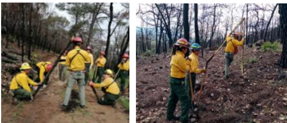
Fig. 4.- Capacitación para la fabricación y uso de nivel “A” para establecer curvas de nivel en los trabajos de conservación de suelos.

Para esto, se capacitó como primera actividad a la brigada en formar un nivel Tipo “A” para realizar las curvas de nivel (fig 4). Después de fabricar el nivel y describir su función, se inició con las actividades de acordonamiento de material muerto, rocas y zanjas a curvas de nivel además de estabilizar cárcavas en zonas para evitar la pérdida de suelos.