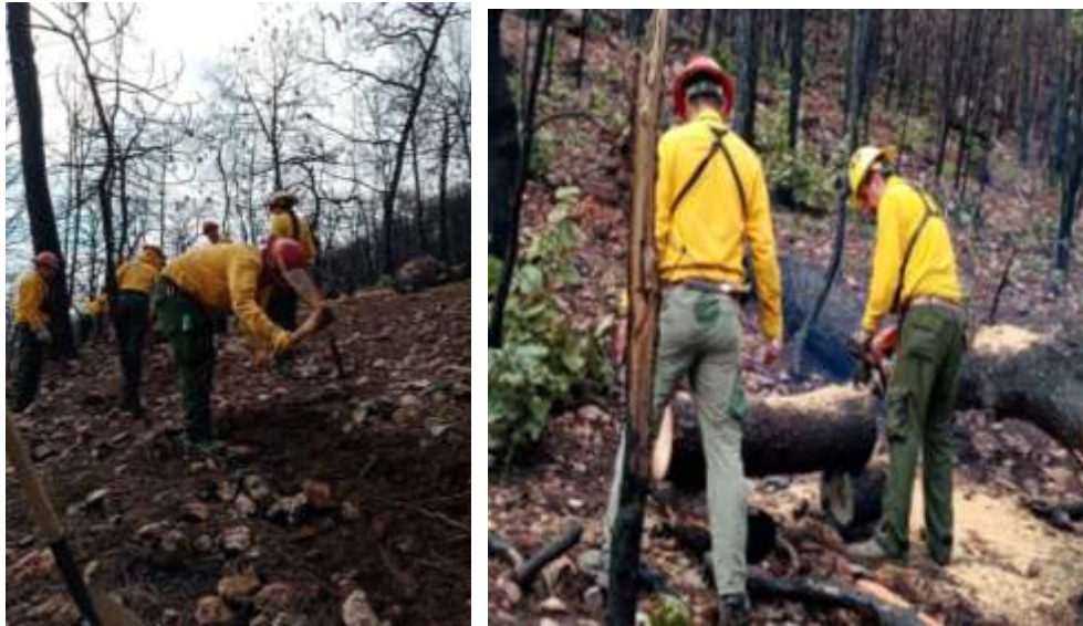
Fig. 5.-Obras de retención de suelos y estabilización de cárcavas.