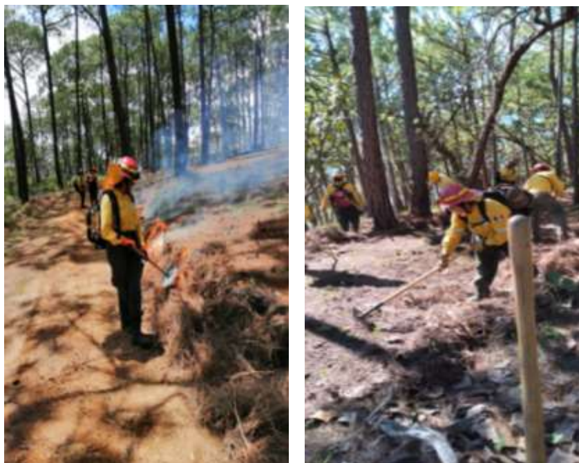
Fig. 3.- Realización de líneas negras y apertura de brechas cortafuego en la localidad de Juanacatlán, municipio de Mascota Jalisco.