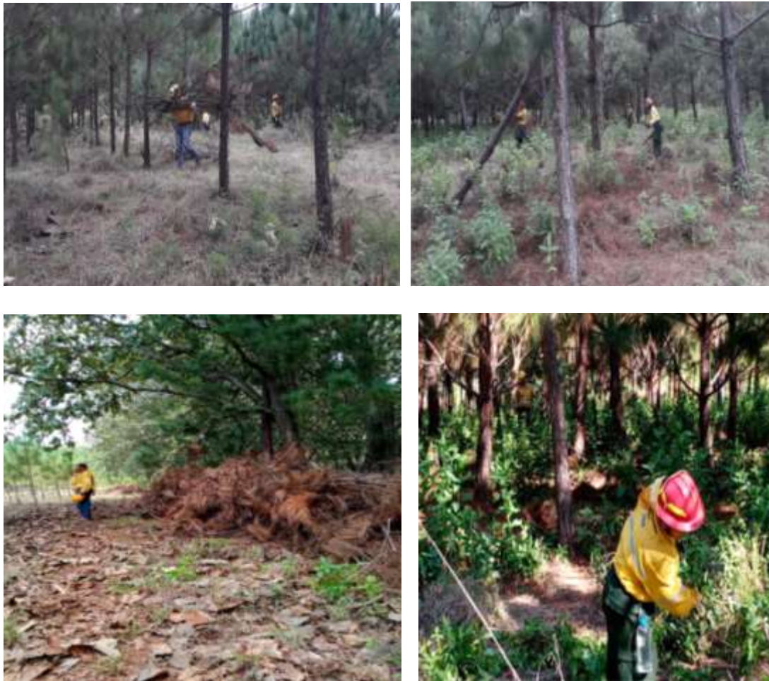
Fig 2.- Acordonamiento de combustible y deshierbe de Huerto Semillero.

Como seguimiento a los trabajos en el municipio, se visitó la localidad de Juanacatlán donde se realizaron obras de prevención física, principalmente aperturas de brechas cortafuego y líneas negras en la periferia de un predio bajo manejo forestal experimental. El objetivo fue proteger el área de renuevo forestal bajo una brecha cortafuego y realizar líneas negras en las áreas de arbolado adulto.