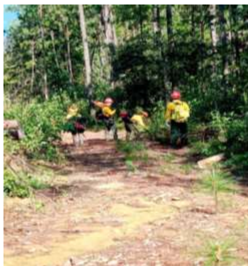
Imagen 1.- Rehabilitación de brecha cortafuego, acordonamiento de madera y mantenimiento a caminos forestales en el parque estatal bosque de Arce.