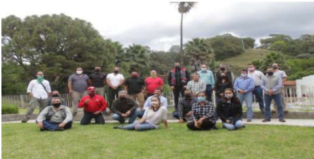
Fig 1.- Presentación de propuesta de programa de capacitación y entrenamiento para bomberos forestales por parte del Coordinador de Manejo de Fuego de la JISOC.